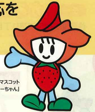
鹿沼市マスコット 「ベリーちゃん」

認知症になっても、できる限り住み慣れた地域のよい環境で 暮らし続けられるために、認知症の人や家族に早期に関わる 「認知症初期集中支援チーム」を設置しました。